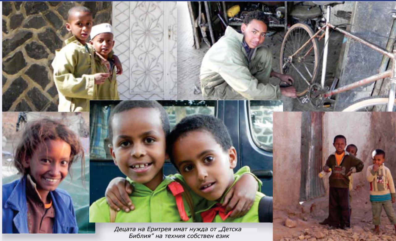
Деца на Еритрея имат нужда от „Детска Библия“ на техния собствен език

Бих искал да ви покажа сияещите лица на тези учители, които от цяло сърце желаят да преподават Словото Божие. Но рискът, който те поемат като учат децата за Христос, е огромен. Рядко съм виждал през всичките си години на работа с преследвани християни такива отдадени на делото вярващи християни като тези в Еритрея.